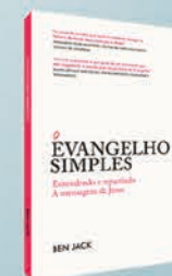
O Evangelho Simples