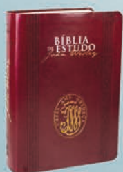
Bíblia de Estudo John Wesley