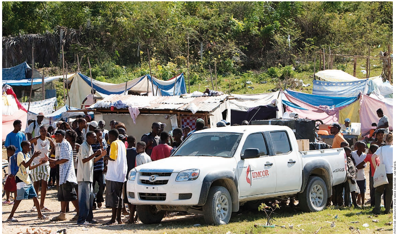
Uma equipe da Comissão Metodista Unida de Socorro, juntamente com agências parceiras, distribui suprimentos de tratamento de água para as pessoas que vivem em um campo improvisado em Gressier, Haiti, em 2010. A diretoria dos Ministérios Globais Metodistas Unidos e da Comissão Metodista Unida de Socorro designou US$ 110.000 para fornecer ajuda humanitária no Haiti.