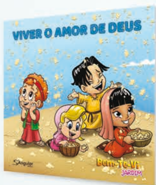
Bem-te-vi Jardim [4-6 anos]

Organizada em três unidades: Eu e Deus; Eu comigo mesmo(a); Eu e as outras pessoas. Através da história de personagens bíblicos e de comunidades de fé, aprendemos sobre viver, compartilhar e testemunhar o amor de Deus com todas as pessoas. Os materiais atendem aos alunos e alunas de todas as idades, com uma revista única para professores(as).