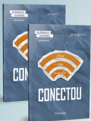
Flâmula Juvenil [adolescentes]

Revistas para adolescentes, jovens e adultos(as)