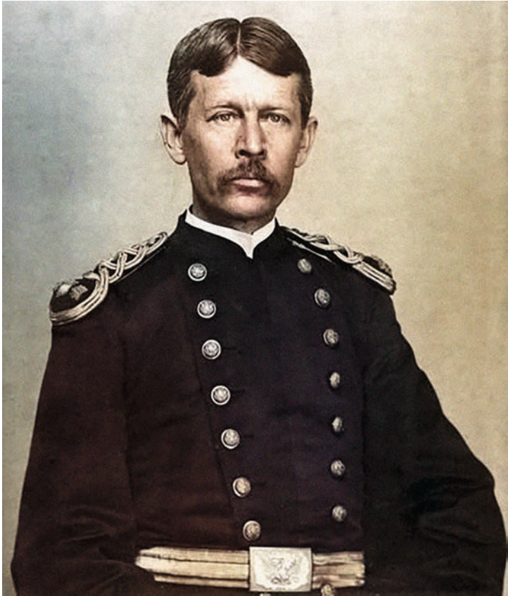
O trabalho mais significativo de Walter Reed foi feito com a Comissão de Febre Amarela do Exército dos EUA. Junto com outros colegas médicos e cientistas, foi capaz de desvendar o flagelo, a febre amarela que era um mistério desde o século XV.