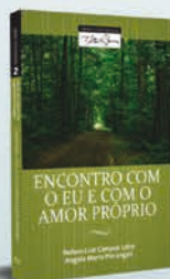
Encontro Com o Eu e o Amor