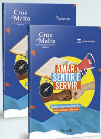
Cruz de Malta [jovens]