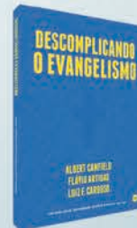
Descomplicando o Evangelismo