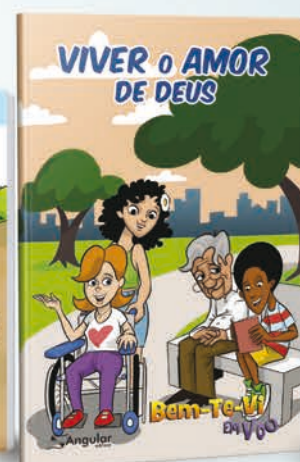
Bem-te-vi em voo [10-12 anos]