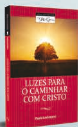
Luzes Para o Caminhar com Cristo