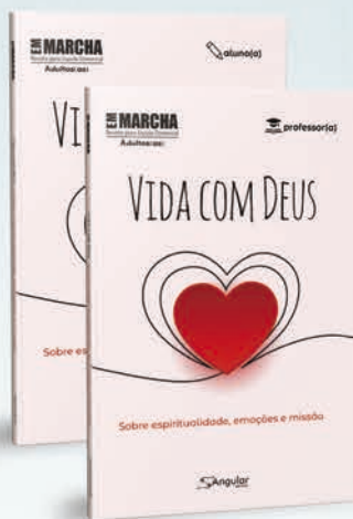
Em Marcha [adulto(as)]

Em tempos de distanciamento social, perdas e lutos, convidamos as pessoas a se aproximarem de Deus, de si mesmas e da missão. Neste exercício relacional, a espiritualidade é fortalecida, a vulnerabilidade humana é reconhecida e respeitada e a chama missionária de anunciar as boas notícias da Graça é reacendida. Esta edição é uma excelente ferramenta para que a Igreja, renovada pelo amor de Deus, siga testemunhando a esperança e a salvação em Jesus Cristo.