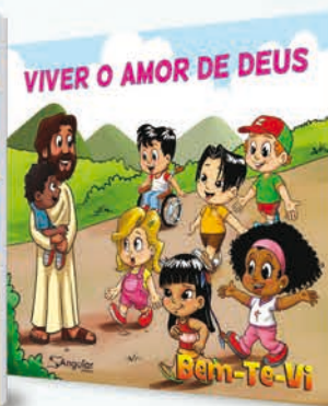
Bem-te-vi [7-9 anos]